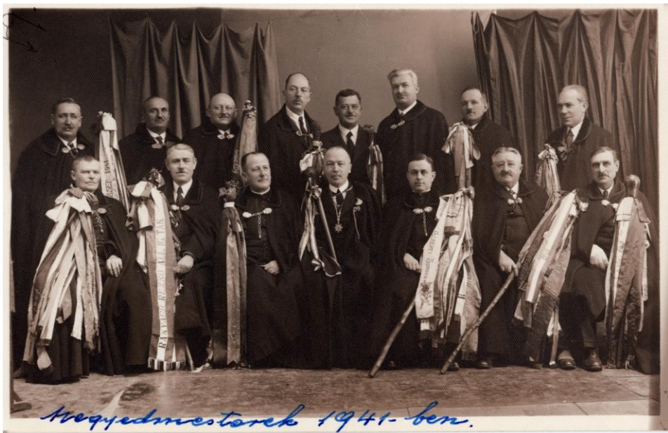
Fertálymesterek csoportképe 1941-ben. MNL HML V-72/b. 10. d.

város által előírt feladatok nélkül, tisztos társadalmi tevékenységként negyedeik szószólói voltak, segítették a szegényeket, gondot viseltek a helyi kulturális értékekre. A fertálymesterség presztízse ekkor érte el a csúcspontját, hiszen magas rangú főpapok, országgyűlési képviselők, megyei és városi vezető tisztviselők is megtiszteltetésnek vették, ha fertálymesterek lehettek. A 18-19. században nem volt egységes fertálymesteri testület, hanem az egyes negyedek szerint 12 elkülönülő csoport létezett, amelyhez a még élő összes fertálymester tartozott. Ilyen keretek között választották meg évente az új negyedmestereket, tartották meg az összejöveteleket és vezették a fertálymesteri naplókat. Az összes fertálymester évente csak egy alkalommal, Szent Apollónia napján (február 9.) jött össze, amikor a jellegzetes szávráncú köpenyben és a szalagos fertálymesteri bottal részt vettek a bazilikában tartott szentmisén, és a városházán letették az esküt. Az egységes fertálymesteri közösség Egri Negyedmesteri Testület néven 1931-ben alakult meg, és fogta össze az egyes negyedek képviselőit, működött megválasztott tiszttal és a fertálymesterek tízparancsolatában megfogalmazott elvek, célkitűzések szerint. 2 (1. kép)